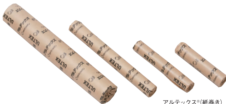
アルテックス ® (紙巻き)