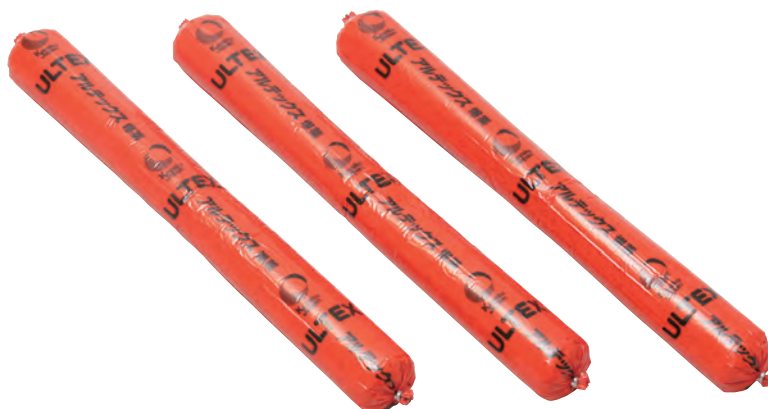
アルテックス ® (ポリ品)