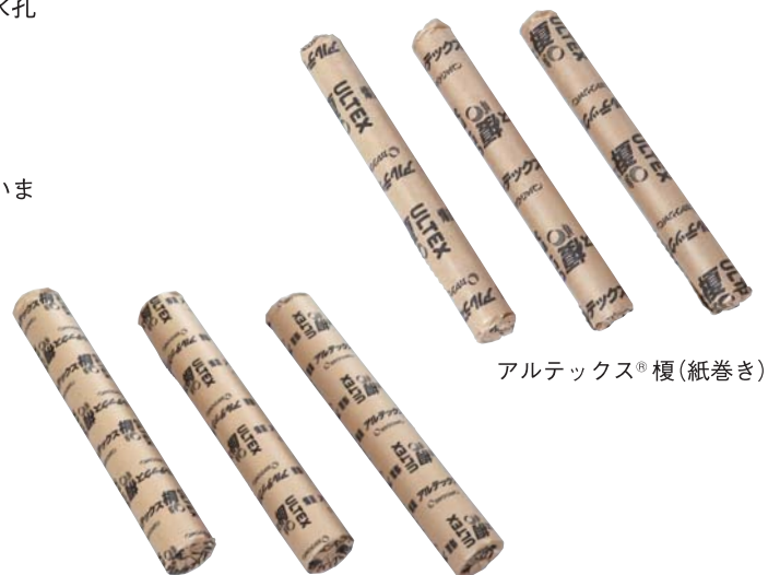
アルテックス® 榎 (紙巻き)