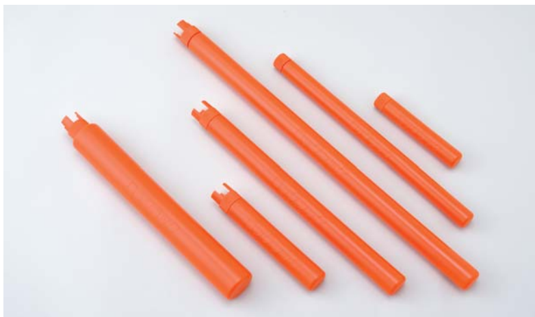
カートリッジ(左からロックラック®1000、200、500、800、300、100)