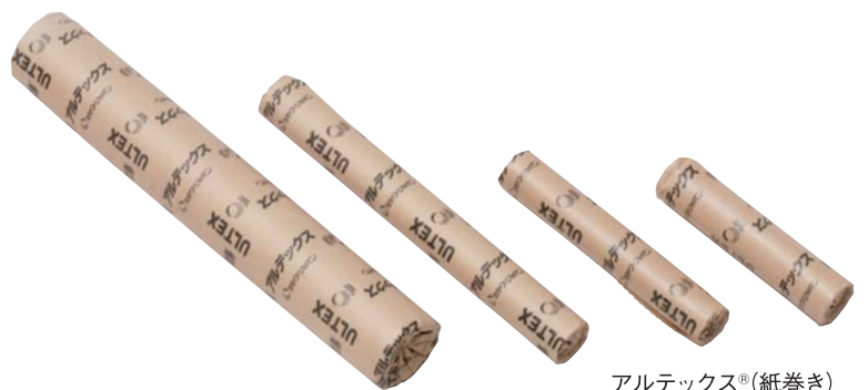
アルテックス®(紙巻き)