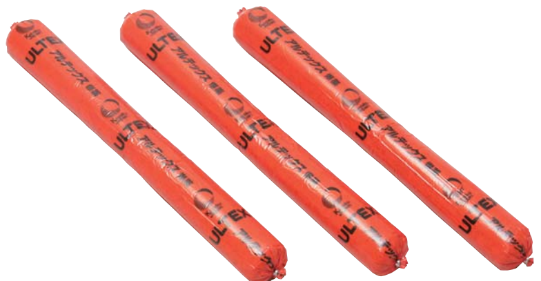
アルテックス®(ポリ品)