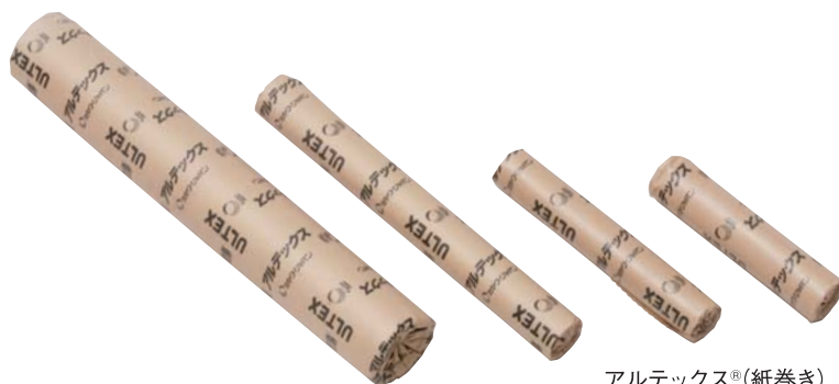
アルテックス®(紙巻き)